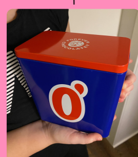
När jag har vaknat så dricker jag lite oboy