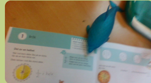
Vi lär oss om bråk