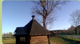
Här går vi in.