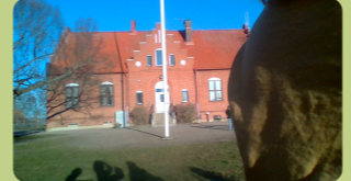
Det här är vår skola