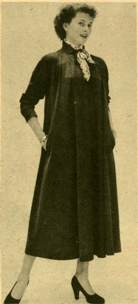
K. 54—2118 — et praktisk plagg for den som har noe å kamouflere.

Omstendighetstøy fra en tid da svangerskapet skulle skjules. Fra Kvinner og Klær 31/1954.