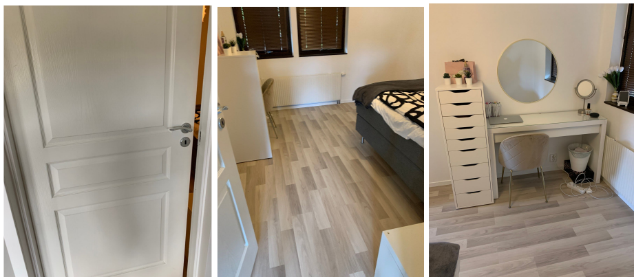
Dörren in till mitt rum Det första man ser Skrivbordet och byrån och min stol kiwi

Jag har ett eget rum som jag sover i och där jag och mina kompisar brukar va i. Jag har en 140x200 säng som jag sover i. I mitt rum har jag inte jätte mycket möbler men jag har en garderob, skrivbord, byrå och en säng.