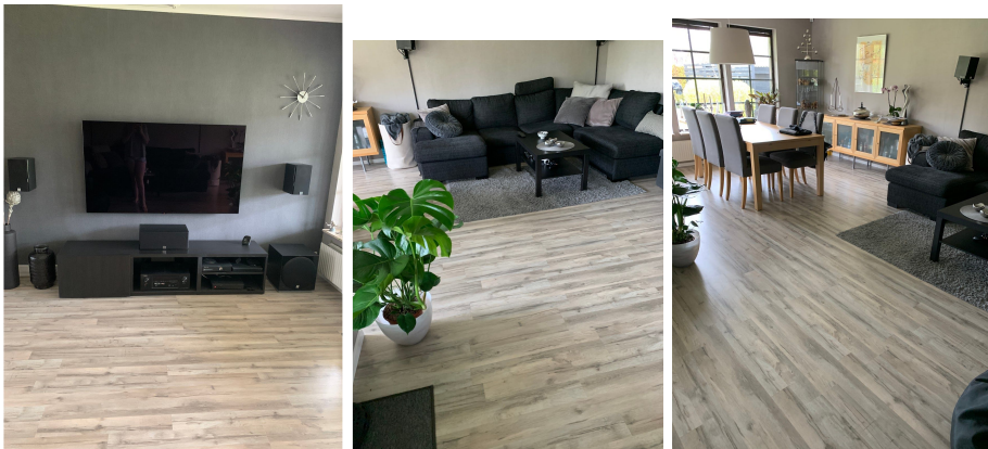
Min favoritplats i huset

När jag är hemma i mitt hus så brukar jag titta på Youtube på tven, göra läxorna (plugga), jag brukar gå ut och spela fotboll med kompisar. Min favoritplats i mitt hus är mitt rum och tv rummet.