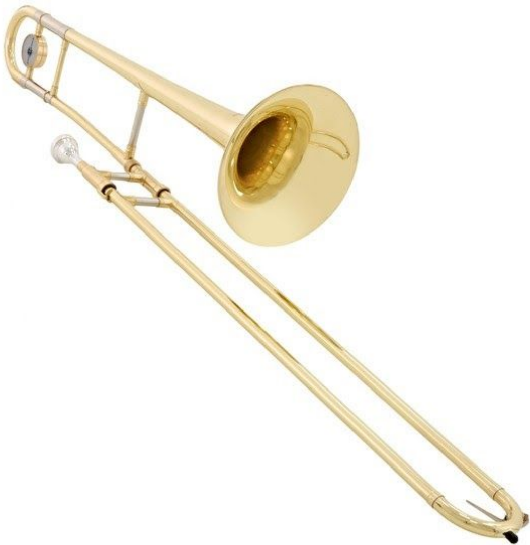
Bild på vårt vardagsrum, min dator, mitt rum och min trombon.

På onsdagar så tar jag tåget in till ystad från köpingebros tågstation och på tisdagar tar jag bussen från nybrostrand. På onsdagar, fredagar och söndagar duschar jag.