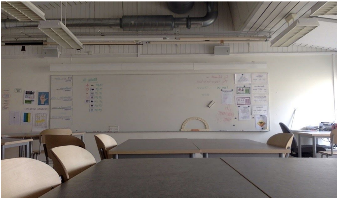
Bild på vårt klassrum

Om jag har tid över så tittar jag på mobilen tills 8.00 och då går jag till bussen. Om jag stöter på någon kompis på vägen så går jag med dem till bussen. Om jag kommer till bussen innan den har kommit så pratar jag med kompisar tills bussen kommer.