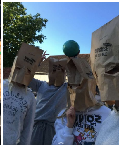
När vi hade påse på huvudet