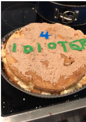
Vår egna tårta vi gjorde